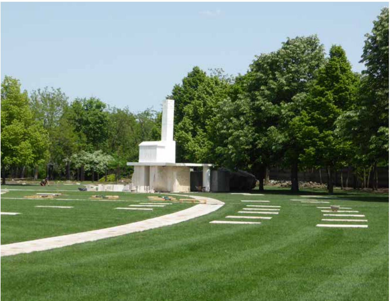
New Public Cemetery (Rákoskeresztúri sírkert) hører, med et areal på ca. 2 kvadratkilometer, til blandt Europas største kirkegårde. Den blev åbnet i 1886 og rummer - blandt meget andet - afdeling 301, hvor heltene/ martyrerne fra 1956-revolutionen er begravet.

asken placeres på en centrifuge, der drejer urnen hurtigt rundt, så asken slynges ud af sprækkerne. Dette foregår indenfor en ring af fontæner, hvor vandet fra fontænerne opfanger asken og skyller det ned i en 8 meter dyb brønd, fyldt med knytnevstore sten, hvor asken aflejres. Systemet er lukket, så asken ikke kommer i forbindelse med det almindelige spille- eller drikkevand. Askespredningen foregår ved en lille musikledsaget ceremoni, som de pårørende kan overvære. Efterfølgende kan familien få den afdødes navn sat på en af de mange mindesten, der er opstillet i et særskilt anlæg ved askespredningspladsen. Budapesti Temetkezési Intézet ZRT driver også Budapests eneste krematorium, hvor der fortages ca. 17.000 kremeringer om året. På de 2 kirkegårde, foretages der mellem 3.600 og 4.200 askespredninger med vand hvert år; svarende til 20 – 25 % af de kremerede.