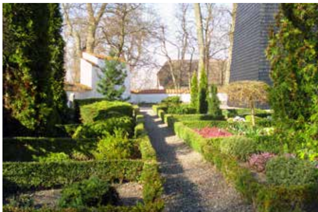
Gloslunde kirkegård er et eksempel på en landsbykirkegård tæt sluttet om middelalderkirken og lige ved siden af præstegården.

Af postdoc Christian P. Kjøller, cpk@ign.ku.dk IGN, Københavns Universitet