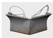
Nesbo V-plov, 130 cm