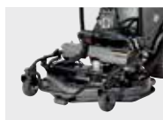
RM125 rotorklipper, 125 cm