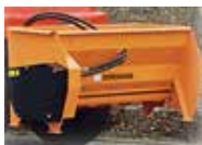
Saltudlægger, Hydromann 100H