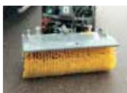
Nesbo fejmaskine, 120 cm

Med Kärchers lave lydniveau og mange tilvalgsmuligheder gør vi alt for, at du kan sidde komfortabelt i markedets bedste førerplads. Til MIC 26 C Advanced kan der vælges redskaber fra vores store redskabsprogram bl.a. markedets bedste feje-sugeanlæg, saltspreder samt kantskærer m.m.