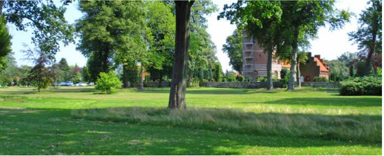
Gladsaxe Kirkegård er et eksempel på en forstadskirkegård i den forstand at det er en stærkt udvidet landsbykirkegård i et nyere forstadsområde. Kirkegården er dog udsat for de samme udfordringer de klassiske bykirkegårde.

og sammenlægninger. Det ses ofte i områder med små sogne, hvor man samarbejder om driften eller lægger menighedsråd og dermed også af forvaltningen af kirkegårdene sammen. Konstruktionen kan variere, men gravere og menighedsråd får i stigende grad ansvar for flere kirkegårde. Hvor der er mangel på kvalificerede gravere kan der etableres et formaliseret samarbejde, hvor en større kirkegård i nærheden eller en anlægsgartner overtager driften af landsbykirkegården helt eller delvis.