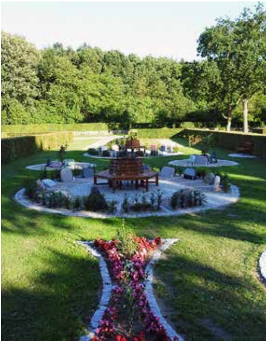
Urnelunden på Brøndbyvester nye kirkegård er blevet så populær, at der i år er lavet en ny afdeling magen til.