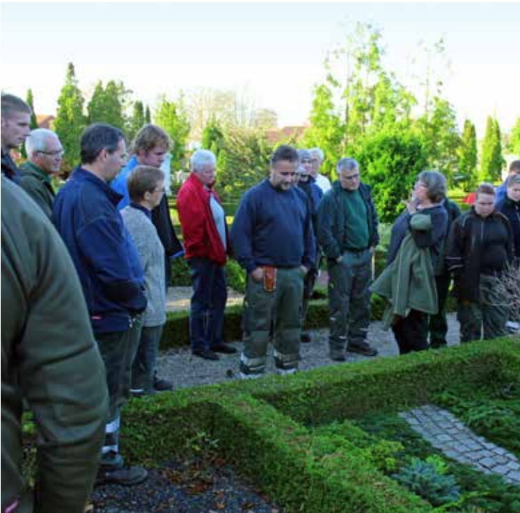
Efter frokosten var det tid til evaluering af de pyntede gravsteder.