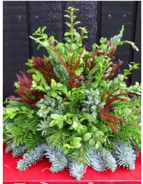
En granddekoration i en oasisblok kan laves hurtigt – og i en fornuftig arbejdsstilling.