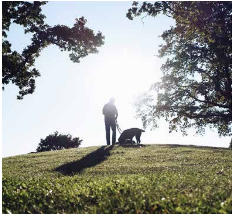
”Jeg har to dejlige hunde som jeg hver dag nyder at gå gode lange ture med, på marken og ved vandet: Kærligheden til dyr har aldrig sluppet mig.”

Efter 17 år - i oktober 2010 - påtog jeg mig jobbet som leder af Brøndbyvester kirkegård. Jeg varetager således ledelsesopgaver for de to kirkegårde, hvor der på Brøndbyvester er tre faste medarbejdere, en elev og en praktikant, og på Brøndbyvester er der fire faste medarbejdere samt en praktikant.