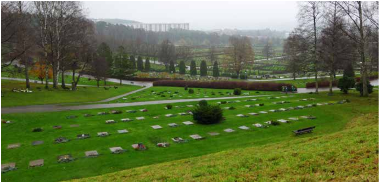
Kviberg Kirkegård blev indviet i 1935 og er med sine 130 hektar Nordeuropas næststørste kirkegård.