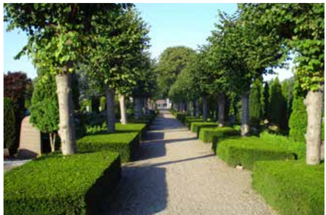
Tønder kirkegård er et eksempel på den typiske købstadkirkegård fra 1800-tallet, placeret i byens daværende udkant. Kistegravstederne er organiseret omkring en gennemgående allé.

Det er en fordel at vide, hvilken type ens kirkegård tilhører. Det giver indblik i kirkegårdens forhold til omgivelserne og overblik over udfordringer og muligheder for kirkegårdens udvikling. Den traditionelle inddeling i landsby- og bykirkegårde skal udbygges, så der både tages hensyn til størrelse men også tilpasning til lokalsamfundet.