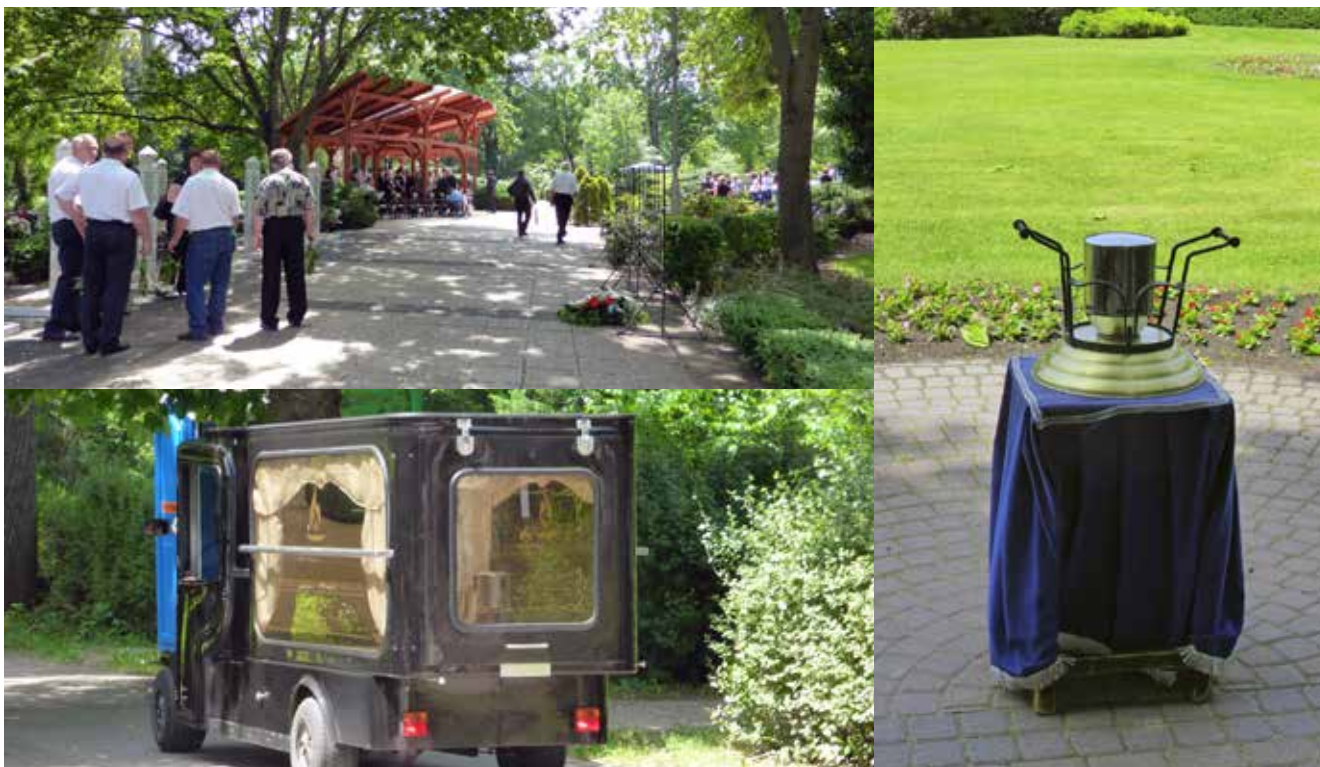
Familien samles på askespredningspladsen og urnen ankommer i en eldrevet rustvogn og anbringes på et lille bord foran de pårørende.