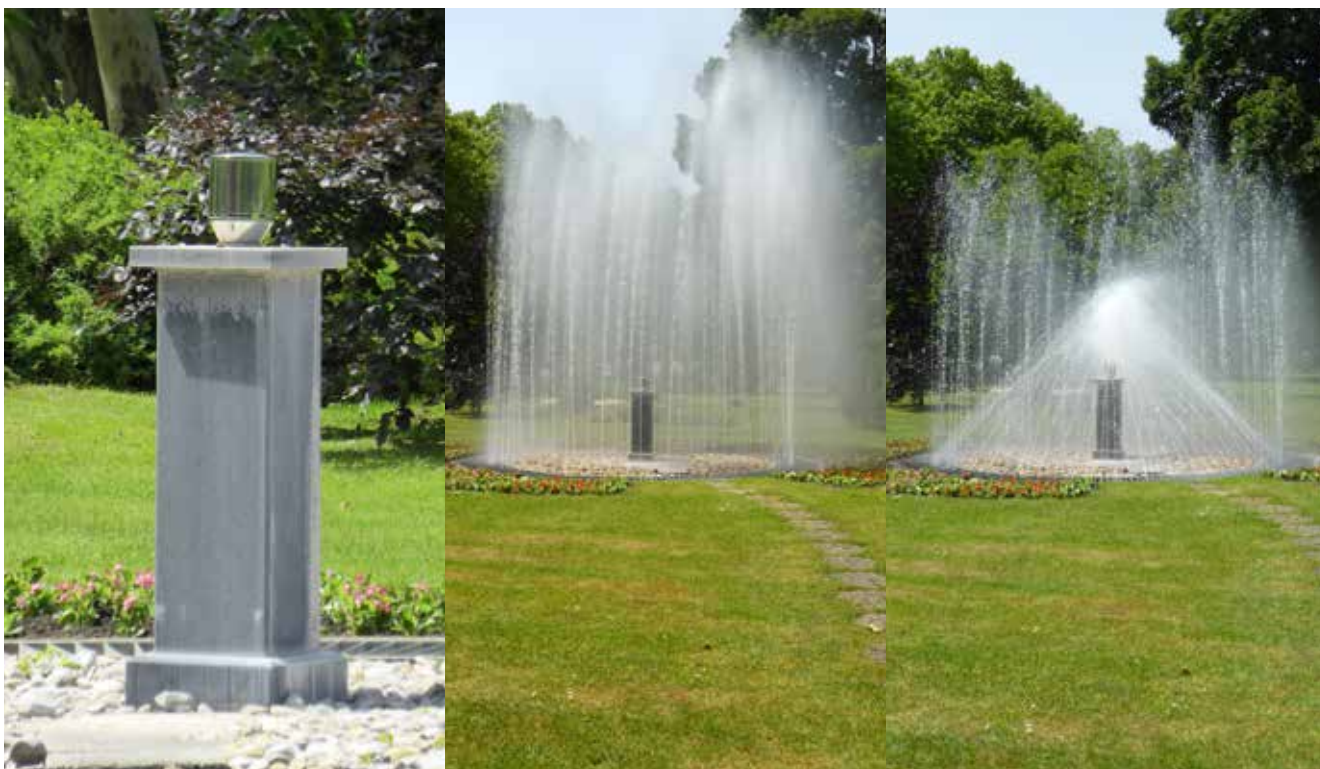
Når asken skal spredes, placeres urnen på en søjle med en centrifuge og fontænerne startes. Urnen slynges nu rundt, så asken spredes ud. Asken opfanges af vandet fra fontænerne og skylles ned i brønden under søjlen med centrifugen. Når urnen er tømt og al asken er skyllet væk, stoppes fontænerne igen. Det hele varer 3 - 4 minutter og foregår under afspilning af et musikstykke.