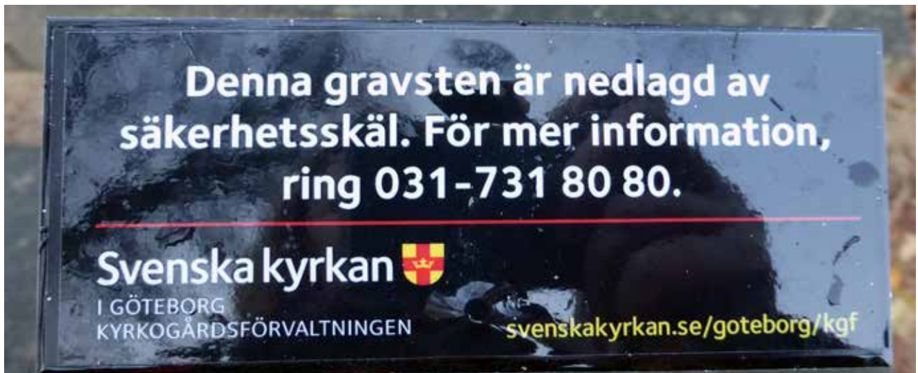
Efter ulykken i Bollebygd, hvor en 8-årig pige blev dræbt af en væltende gravsten, er der kommet meget fokus på sikkerheden på de svenske kirkegårde. Fra Örgryte Gamle Kirkegård.